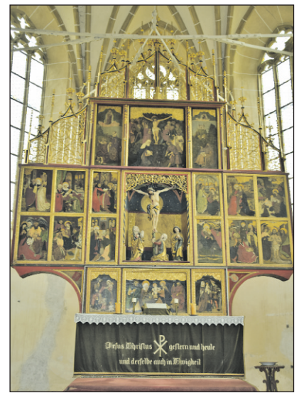
Ein weiteres Kleinod: Der spätgotische Flügelaltar mit 28 Tafelbildern und zartem Sprengwerk, ein bedeutendes Kunstwerk.

Im Erdgeschoss des dreigeschossigen Mausoleums-Turms mit Pyramidendach des ersten Burgrings, wurden