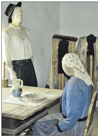
Das Ehegefängnis: Hier wurden die streitsüchtigen Paare eingesperrt, bis sie sich wieder vertrugen.

fühl der ganzen Familie, bis er alle Kriterien erfüllt hatte, um in der Schweiz als Pfarrer zu arbeiten. Aber auch hier konnte er seine Fähigkeiten im Umgang mit Jugendlichen einsetzen. Wenn auch seine Art in der Vergangenheit ab und zu auf Unverständnis stiess, blieb er seinen Grundsätzen treu und verfolgt den von ihm eingeschlagenen Weg mit Überzeugung. Seinen früheren Kirchenkindern in Siebenbürgen hatte er versprochen, sie nie zu vergessen!