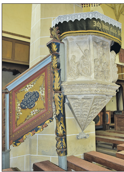
Die steinerne Kanzel von 1523: Die Reliefszenen am Kanzelkorb sind von Bedeutung.